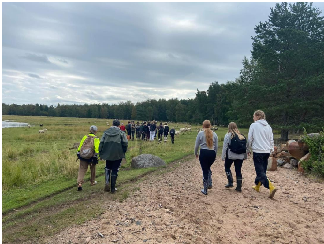
Viestiminen maisemanhoidosta ja elinkeinosta: some, koululaisvierailut...