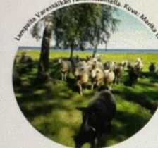
Lampaiden Varessäikän rantalaitumella.

Tämä taulu on laadittu Luonnonvarakeskuksen hallinnoimassa Rantalaidun-hankkeessa vuonna 2023.