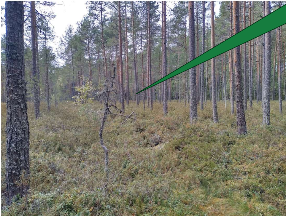
Kuva Tatu Viitasaari

Vastatkaa chattiin. Mitä toimenpiteitä kuvan perusteella suosittelisitte kohteelle?