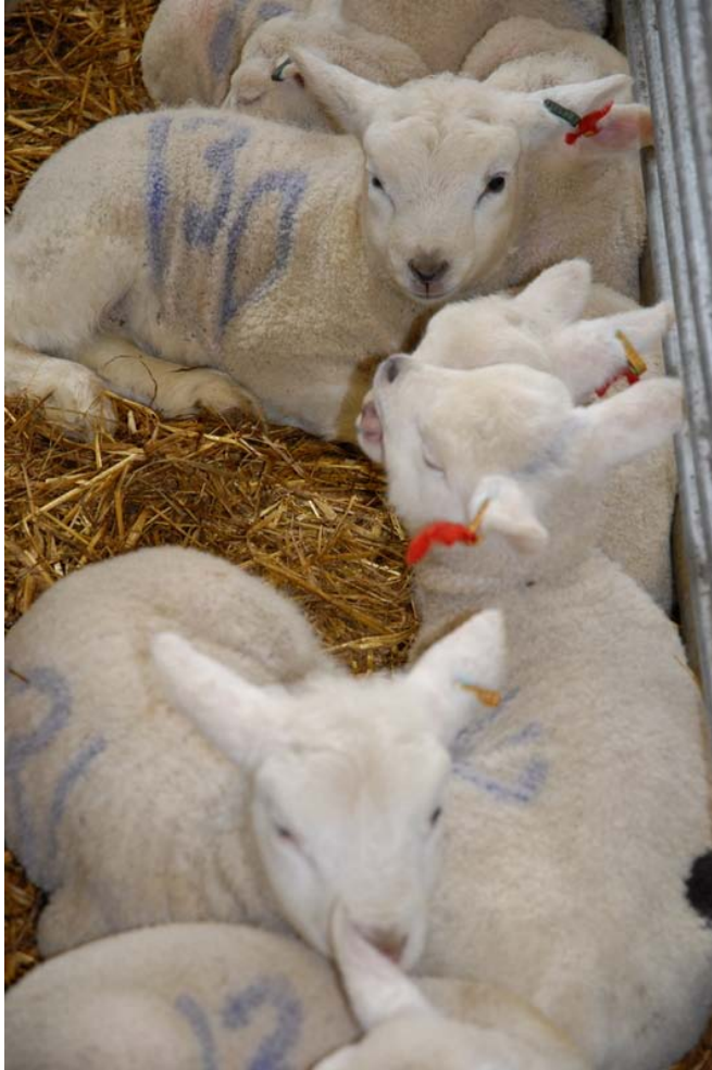
Dorset karitsat, Putkisalon dorset, Rantasalmi