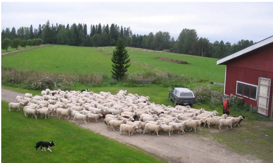
Inkilänhovin luomulampolan kolmiroturistetyksiä tuottava katras, Juva

Itä-Suomi on hyvää nurmen tuotantoaluetta ja siksi märehittijät soveltuvat hyvin alueen kotieläintuotantoon. Täällä on myös paljon laitumiksi soveltuvia alueita ja lampaat voivat olla suurena apuna maiseman ja ympäristön hoidossa, joka on tärkeää niin ekologisesti kuin alueen matkailuelinkeinoa ja viihtyvyyttä parantavana tekijänä.