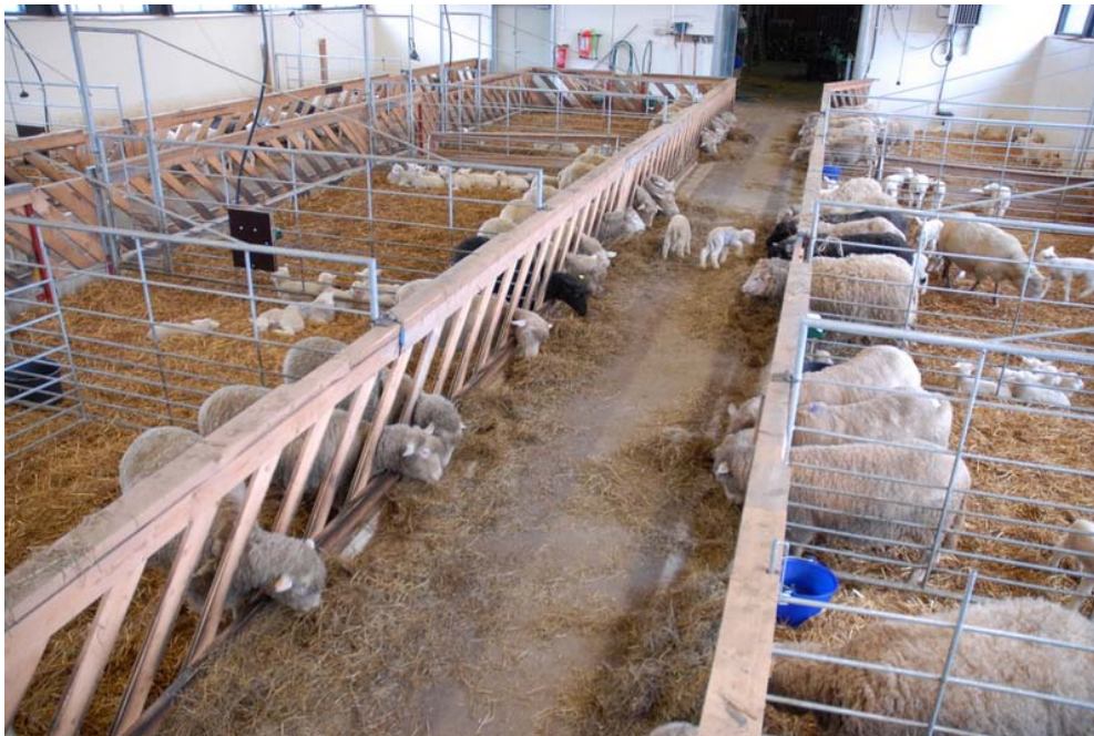
Lampola karitsointiaikaan, Putkisalons dorset, Rantasalmi