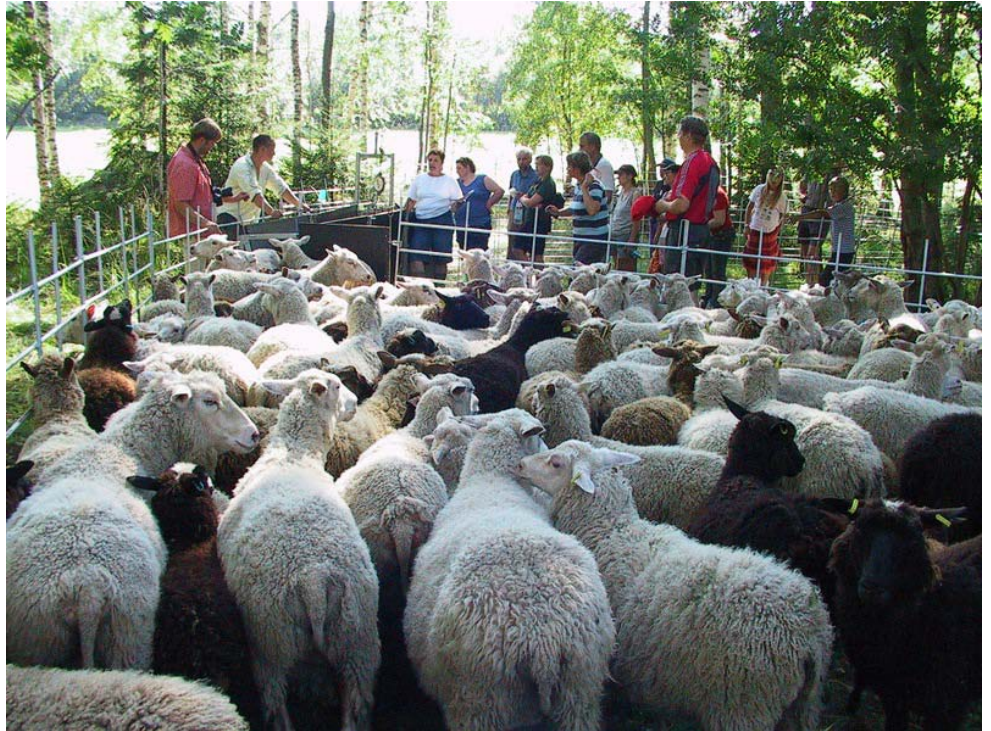
Lampureiden pellonpiennarpäivä, Makkonen, Savonranta