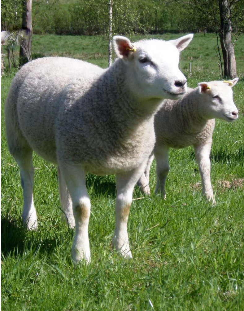
Texelkaritsat laitumella, Suonsaaren texel, Kangasniemi