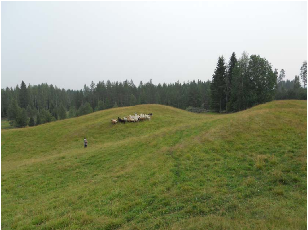
Perinnebiotooppilaidun, Palviainen, Iloanta