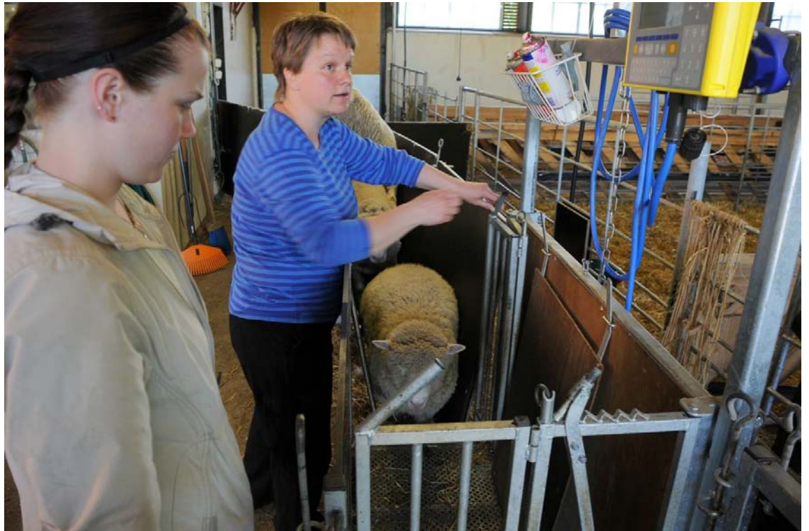
Karitsoiden 4 kk punnitus käsittelyrännissä, Putkisalon dorset, Rantasalmi