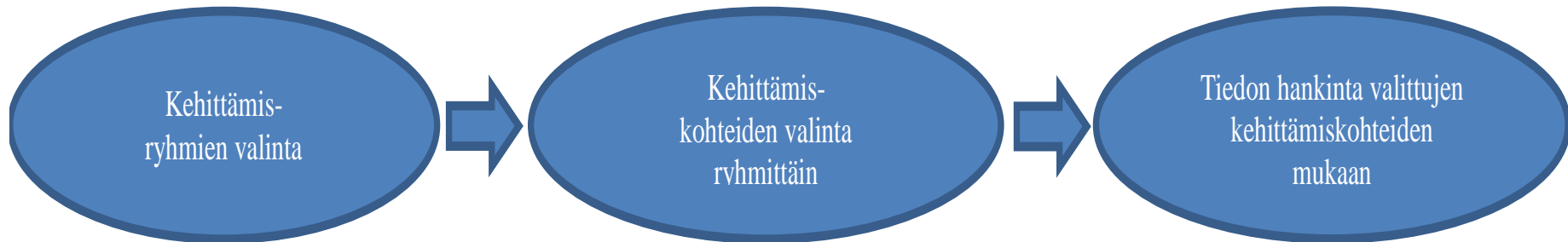
Kuva 1. Kehittämiskohteiden valinta